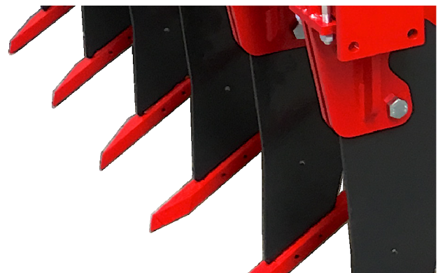
2,4 oder 6 Zinken bei bis zu 3m Arbeitsbreite